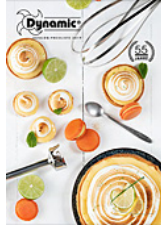
Dynamic Gesamtkatalog 2019 deutsch (6,4 MB)