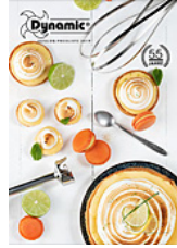
Dynamic Produktübersicht 2019 deutsch (3,2 MB)