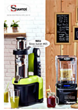
Santos Santos Trendgetränke, Bar & frische Küche 2019 deutsch (2,2 MB)