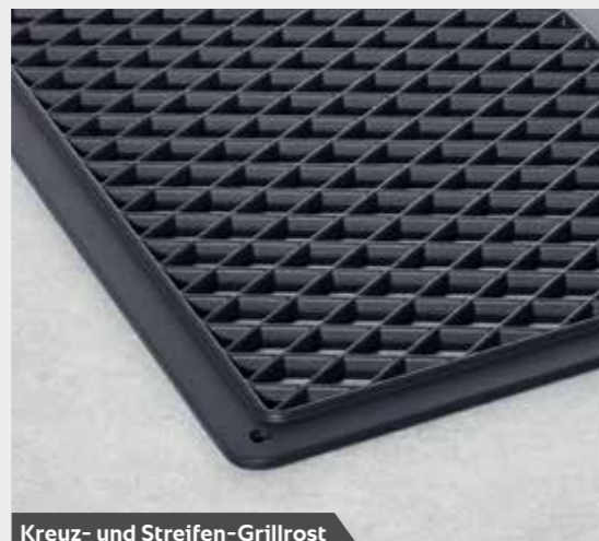
Kreuz- und Streifen-Grillrost