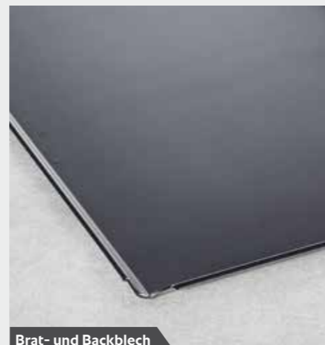
Brat- und Backblech