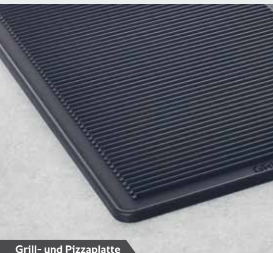
Grill- und Pizzaplatte

Für weitere Informationen fordern Sie bitte unseren Zubehörprospekt oder unsere Anwendungsprospekte an. Oder Sie besuchen uns im Internet unter rational-online.com .